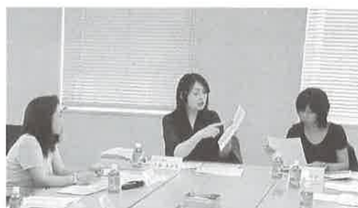
（第5回）提案書のまとめに向けて、熱心な検討が続きました