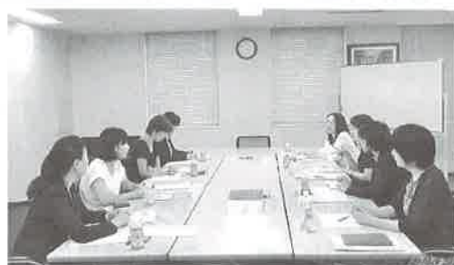
（第1回）机を組み替え、早速メンバーによる検討を開始しました