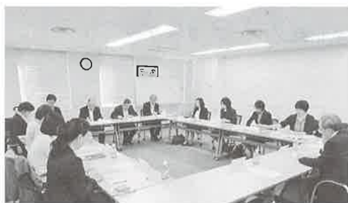
（第1回）冒頭、森専務理事より、PTへの期待を込めた挨拶がありました