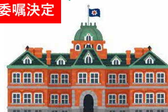
北海道（農政部長） [担当：農政部農村設計課]