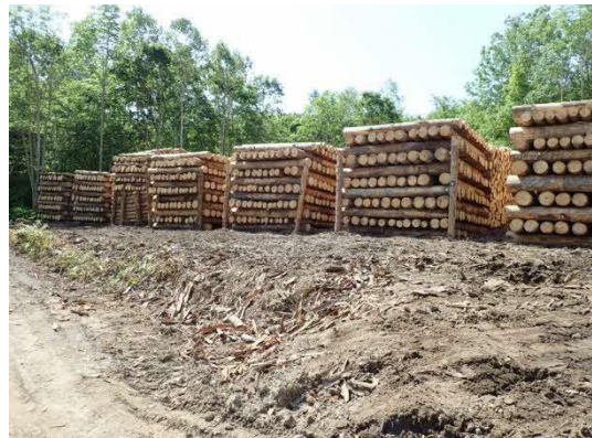
整然と積み上げられた丸太