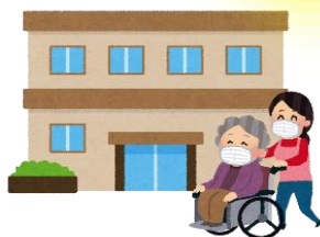
高齢者施設など に行くとき