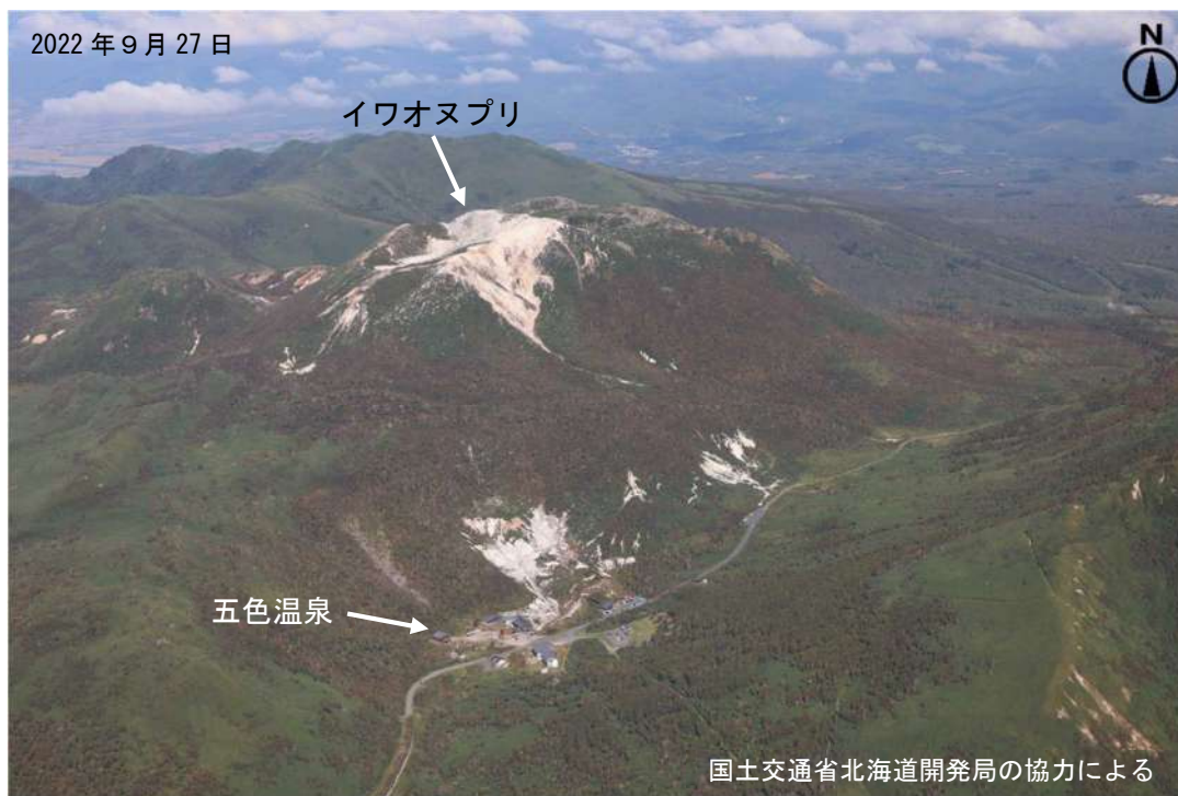
図2 ニセコ イワオヌプリ及び五色温泉周辺の状況 南側上空（図1の①）から撮影