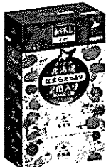
エリエール北海道ティッシュ なまらたっぶり 発売中

本年10月1日（土）以降、新たに4商品が追加されることとなりました！「みらチャレ」のロゴが入った商品をお近くのスーパー、ドラッグストアでお買い求めいただき、北海道の若者の海外挑戦を応援しましょう！