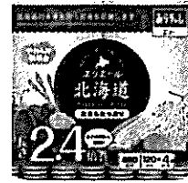
エリエール北海道キッチンタオル なまらたっぶり 2.4倍巻 10 11巻 発売