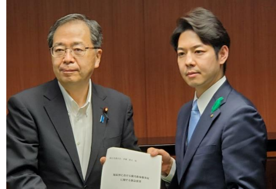
5/17 齊藤国土交通大臣への緊急要望