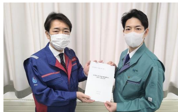
4/28 中山国土交通副大臣への緊急要望