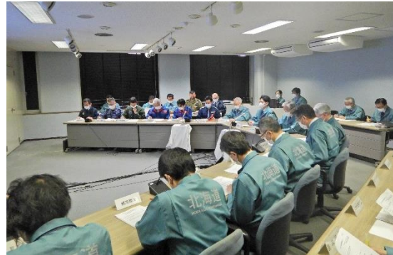
4/23 北海道災害対策連絡本部設置