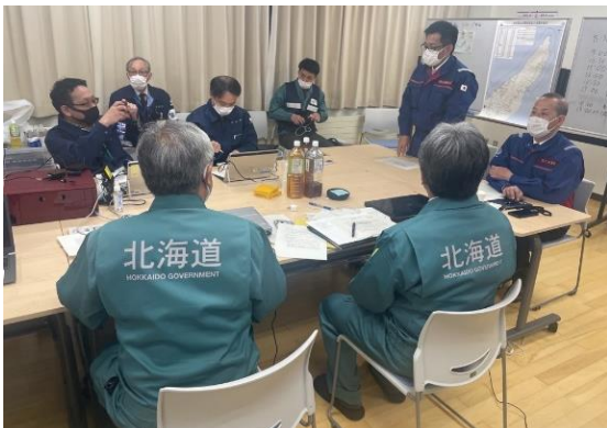
現地対策本部等へのリエゾン派遣（延260人）