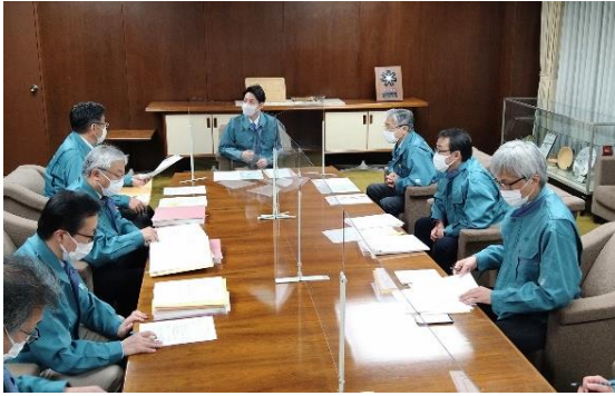
4/23 緊急幹部会議の開催