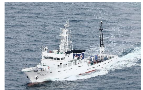
2名を発見した漁業取締船「海王丸」