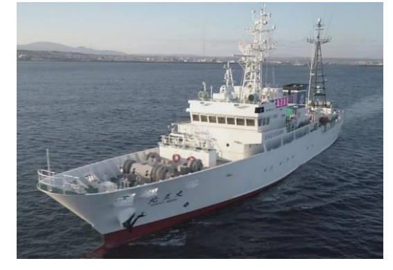
一斉搜索に参加した漁業取締船「北王丸」