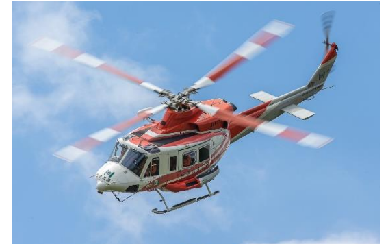
消防防災ヘリによる搜索（16日間）