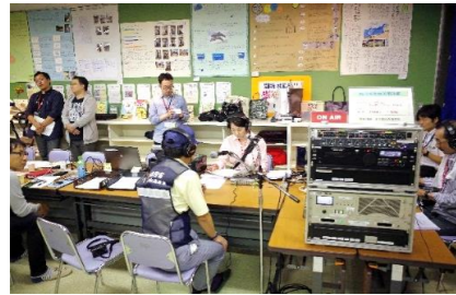
・自衛隊による炊き出し支援：栄緑小