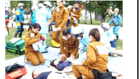
・丘珠SCU開設【丘珠駐屯地】