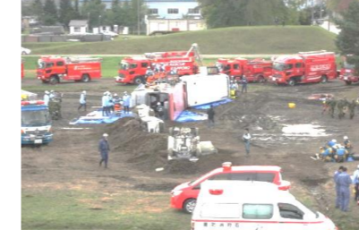
・真駒内SCU開設【真駒内駐屯地】