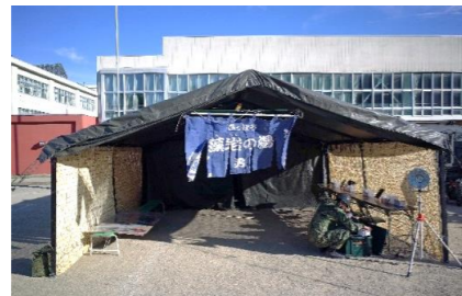
・日本郵便(株)による配達訓練：栄緑小