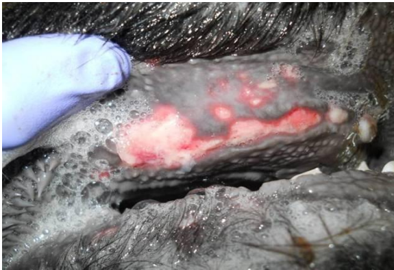
嘴唇上的溃烂（粘膜溃烂）