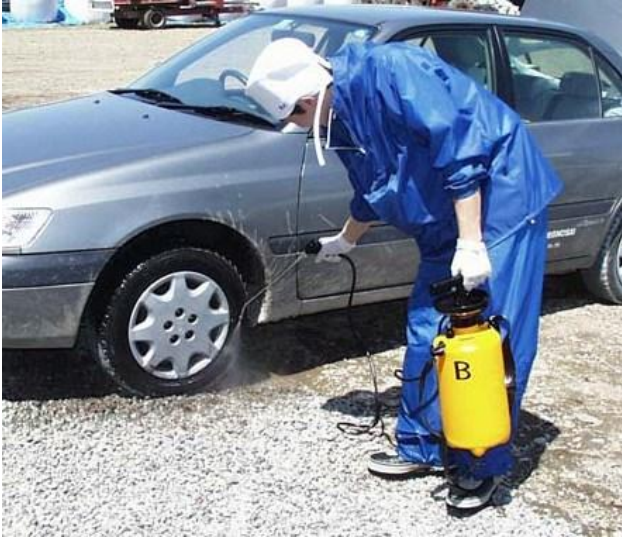
使用消毒泵对车辆进行消毒