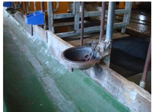
清扫后的食槽，水槽。

清扫供食设备，供水设备等。供食时请确认食槽状况，如果有野生动物排泄物，请立即清除。