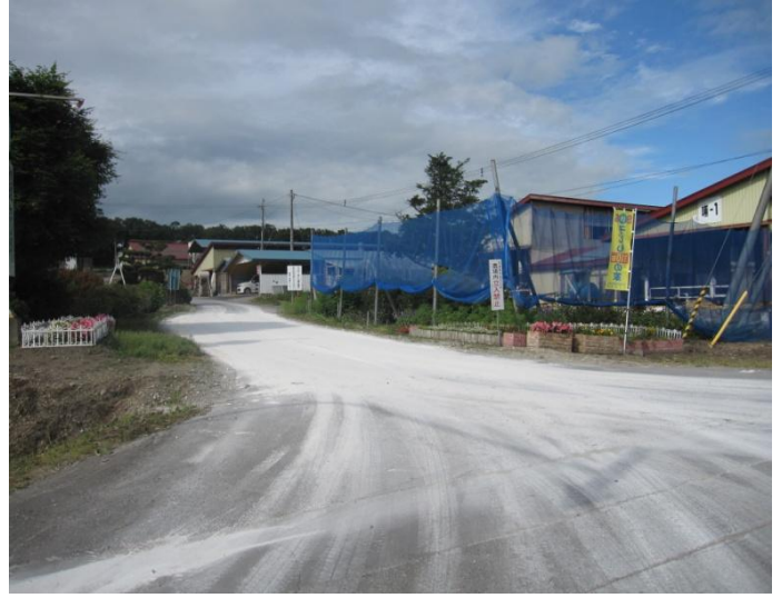
在农场入口散布石灰