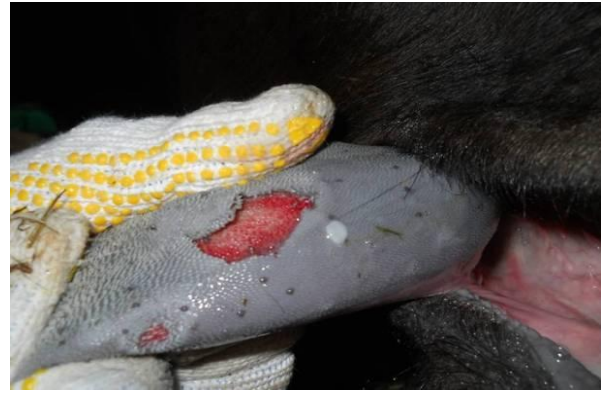
舌头上的溃烂（粘膜溃烂）