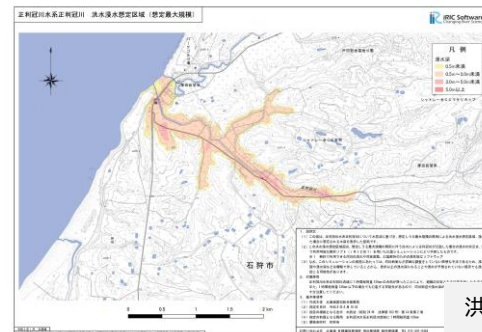
洪水浸水想定区域図 (IRIC)